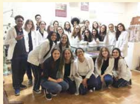
Visita do Colégio Santa Marcelina dia 17/06/2019