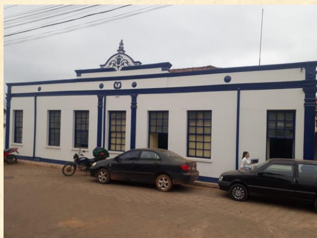
Atual Santa Casa de Misericórdia