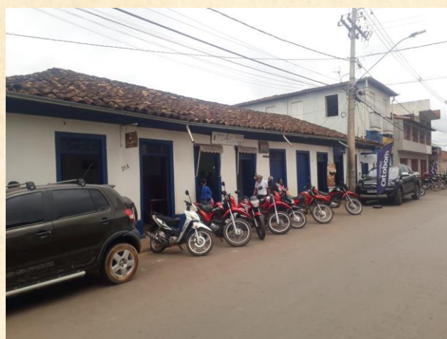
Residência onde morou Dr. Pavie. Hoje é residência de um de seus netos.