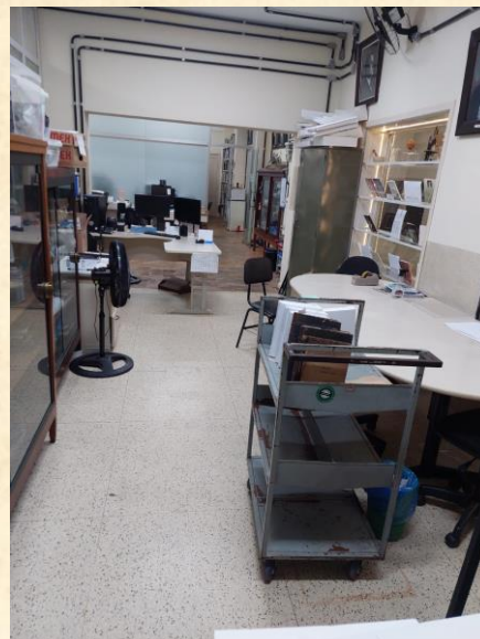
Espaço para conservação e restauro