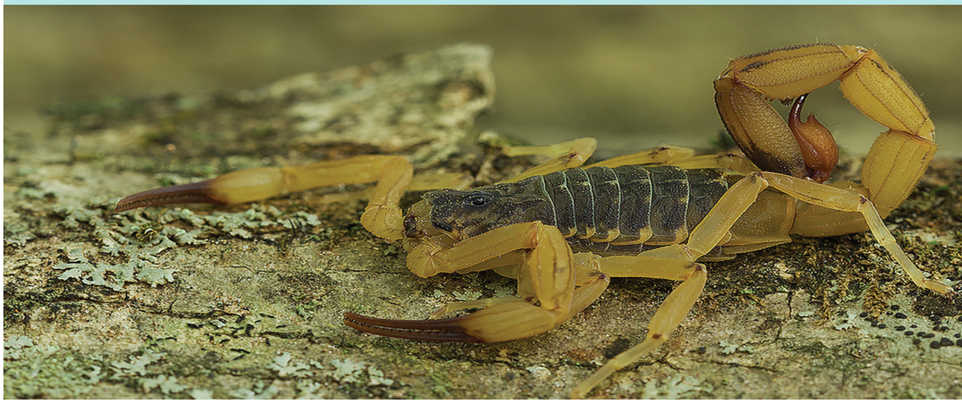
Figura 1. Representação de um escorpião.

Mais frequentes durante a noite, devido ao hábito noturno desses animais, e principalmente em meses quentes e chuvosos.