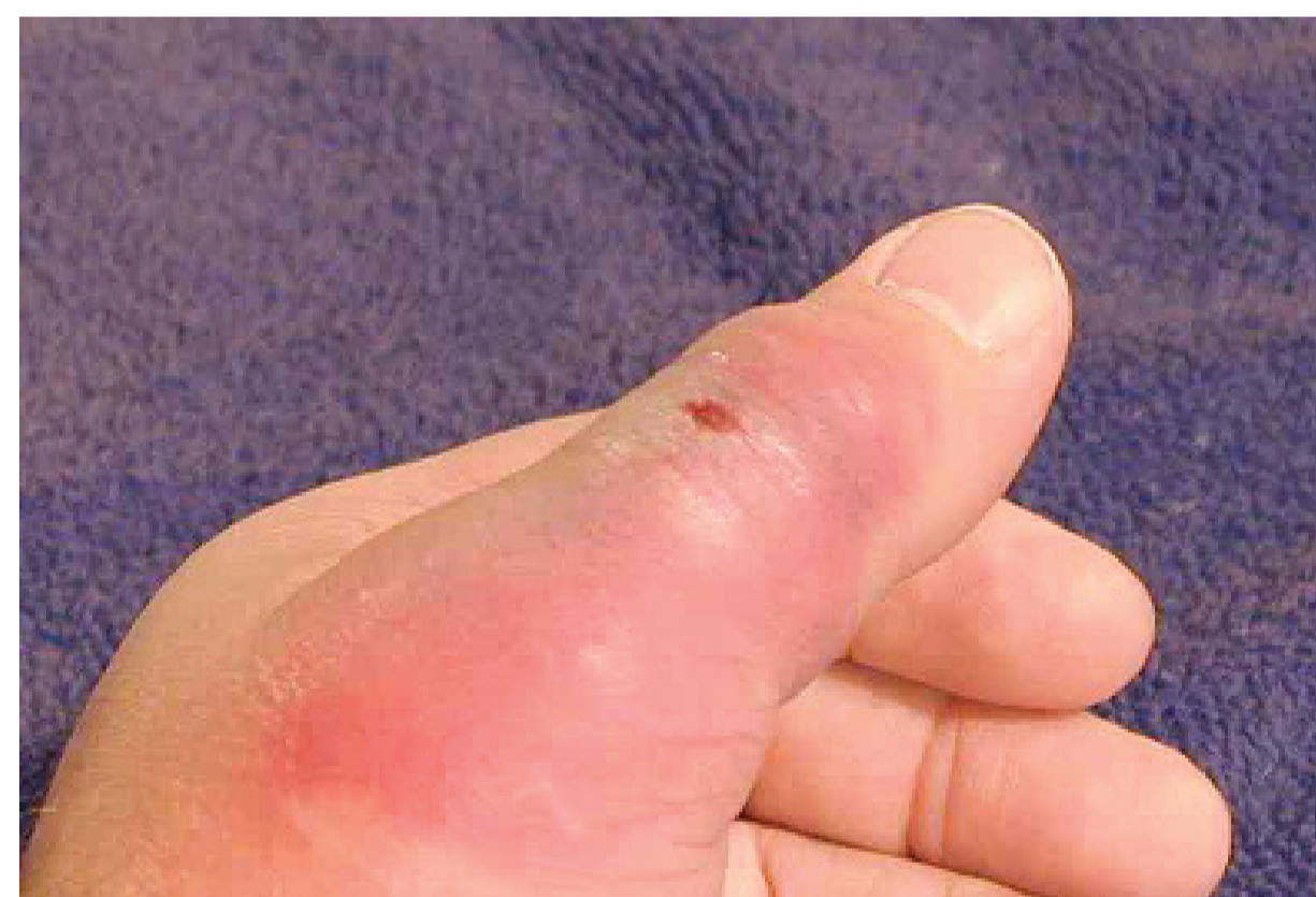
Figura 2: Picada por escorpião

Dor local significativa, imediata e progressiva associada a ardor. Vermelhidão, mais intensa no centro